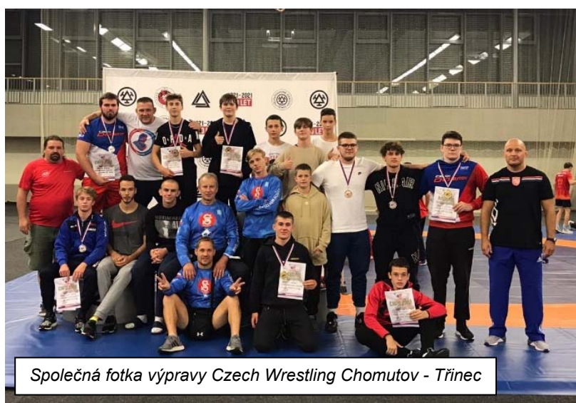
Společná fotka výpravy Czech Wrestling Chomutov - Třinec