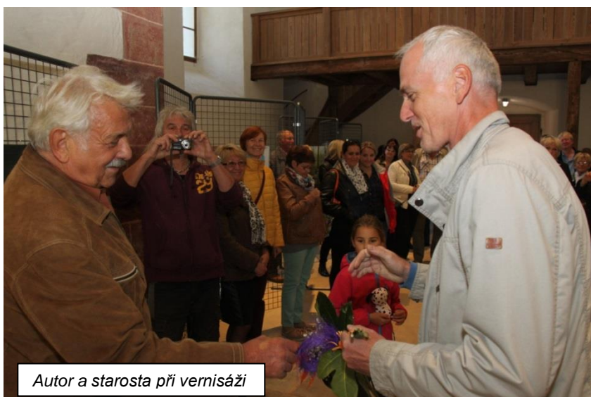
Autor a starosta při vernisáži