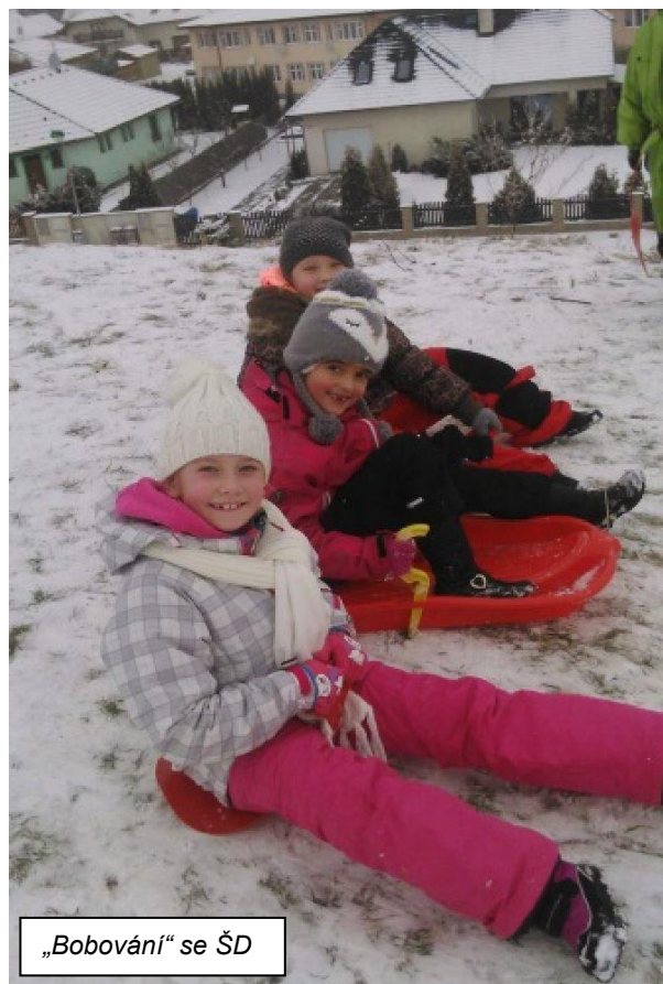
„Bobování“ se ŠD

rodiče byl ve středu 20. ledna 2016 zápis dětí do prvního ročníku ZŠ . Snad větší trému než děti měli jejich rodiče. Pro děti byly připravené různé úkoly jak vědomostní, tak i zavazování tkaniček a tělocvičné úkoly. Dárčky pro děti připravili žáci ze ŠD pod vedením paní Pincové. Děti byly šikovné a věřím, že z nich budou dobří školáci.