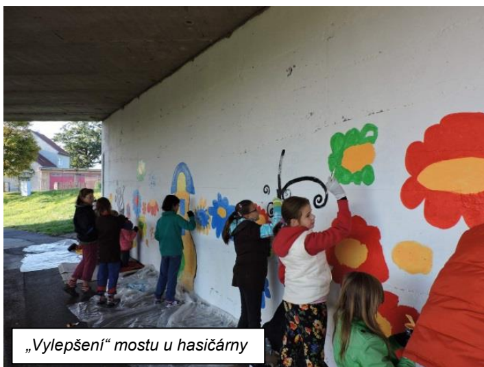
„Vylepšení“ mostu u hasičárny

Ve středu 16. září děti přivítaly ve škole projekt „Zdravá 5“ . Bylo to velice poučné a děti si vyzkoušely různé druhy potravin a získaly spoustu informací ohledně zdravé výživy.