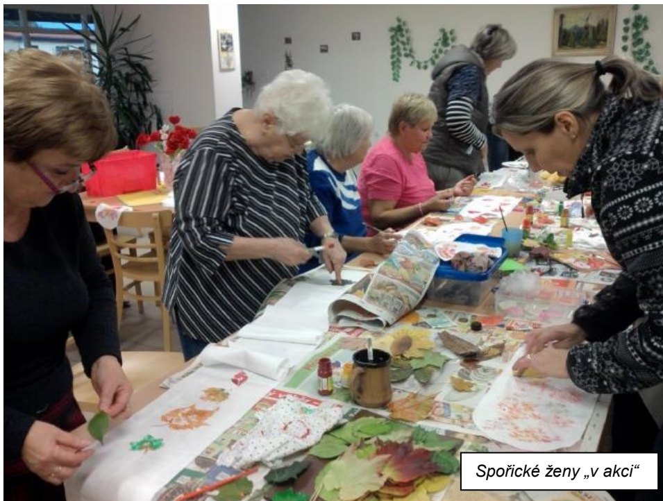
Spořické ženy „v akci“

Pan starosta a obecní úřad nám poskytli potřebnou podporu a zázemí, a my se již druhý rok scházíme pravidelně každý čtvrtek mezi 17. – 19. hodinou v jídelně Domu pro seniory. Pokaždé si uvaříme čaj, probereme