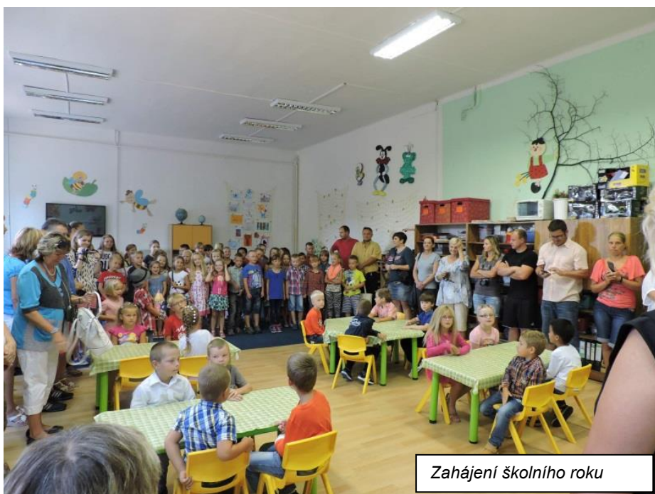
Zahájení školního roku

Ve dnech 9. a 11. září se děti ze ZŠ zúčastnily „ Projektu 72 hodin “. Jednalo se o sázení stromků a zlepšení prostředí. Všech pět. ročníků si zasadilo pět stromků na prostranství u sportovní haly a nyní budeme sledovat, jak nám stromky porostou. V neděli děti pomalovaly stěnu mostu podél chodníku od hasičárny k moštárně. Most je teď veselý a určitě každému zlepšil náladu.