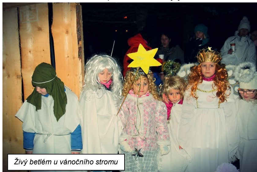
Živý betlém u vánočního stromu

Obec opět připravila na předvánoční čas několik zajímavých akcí. Kromě tradičního výletu do předvánočních Drážďan , který se uskutečnil v sobotu 5. prosince, to byly kulturní akce o adventních nedělích. První adventní neděli 29. listopadu vystoupil v parku u vánočního stromku pěvecký sbor VENTILKY s vánočními písněmi a koledami. Spořické děti ze základní a mateřské školy si připravily „ Vánoční jarmark “, kde nabídly své vánoční výrobky, které se do hodiny bezmála všechny prodaly. Poté byl k vidění živý betlém , který připravili Spořičtí Sokolové. Na závěr jsme se mohli potěšit z rozsvíceného vánočního stromu.