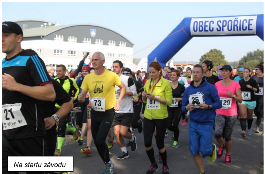
Na startu závodu