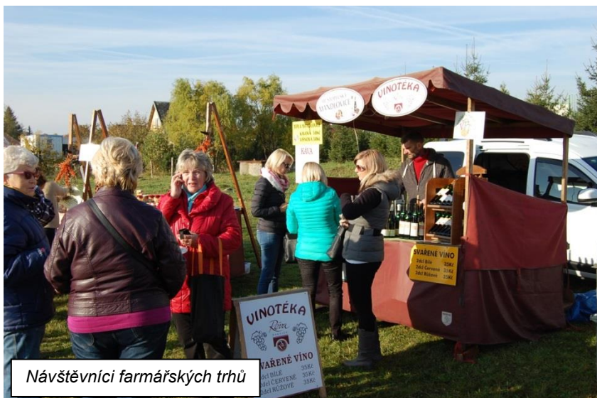
Návštěvníci farmářských trhů

Místní akční skupina (MAS) - Sdružení západní Krušnohoří ve spolupráci s obcí Spořice uspořádala v sobotu 24. října 2015 od 9-ti hodin u spořické sportovní haly další farmářské trhy. Na prostranství mezi koupalištěm a fotbalovým hřištěm si návštěvníci mohli vybrat z nabídky tradičních výrobců a prodejců z okolí, mohli posedět u občerstvení a strávit tak příjemné sobotní dopoledne. Na závěr se mohli zúčastnit losování tomboly, jejíž výtěžek byl věnován na konto „Matýsek“.