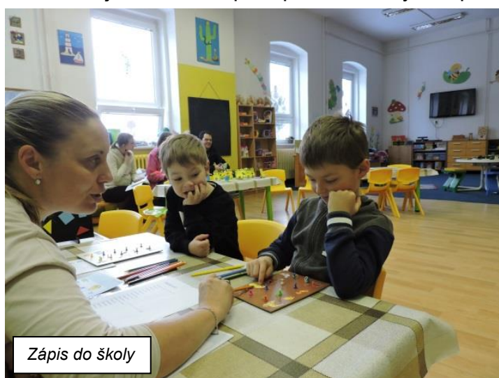
Zápis do školy

Největší akcí pro předškoláčky a pro jejich