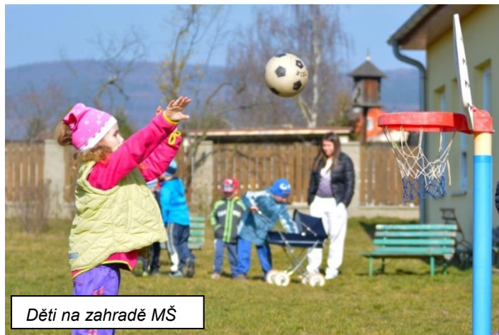
Děti na zahradě MŠ

A co nás ještě čeká? „Zatrsáme“ na písni z Madagaskaru našim maminkám a předáme jim dětmi vyrobený malý dáreček. Ve středu 28. května máme tradiční setkání vesnických mateřských školek tentokrát v Droužkovicích.