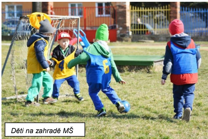
Děti na zahradě MŠ