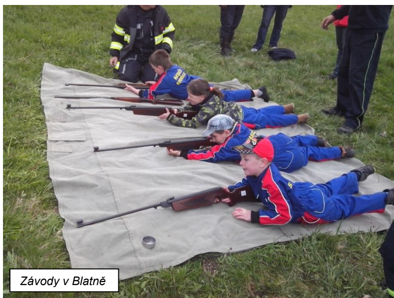
Závody v Blatně