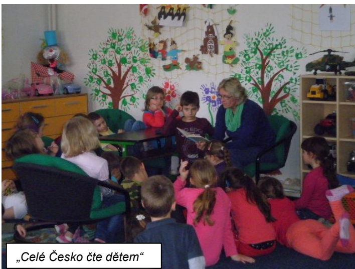
„Celé Česko čte dětem“

Dále jsme zapojeni nově do projektu FÍHA-DÝHA. V rámci tohoto projektu dostanou děti výtvarný materiál v podobě dýhy, ze které poté vyrábějí zajímavé výrobky.