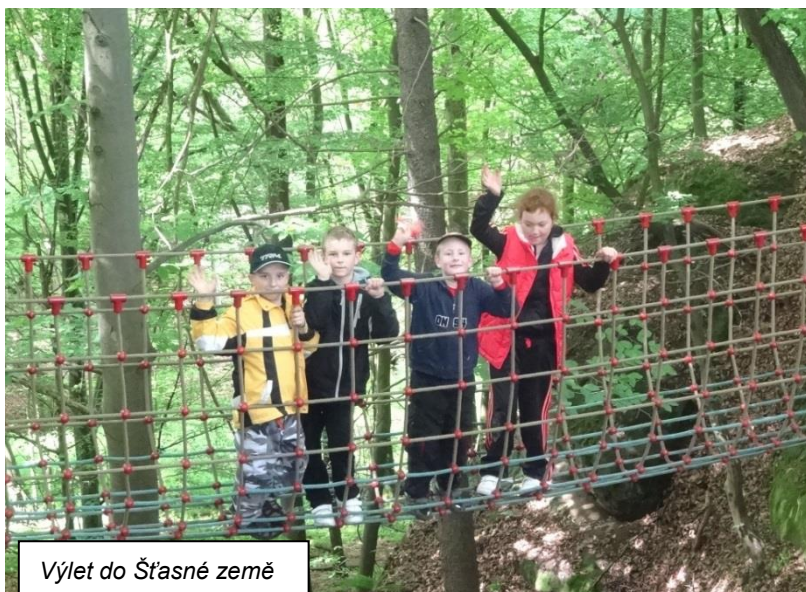
Výlet do Šťastné země

celodenní výlet autobusem, kdy se nejdříve jelo do areálu Šťastné země, kde si mohly děti zaskákat na trampolínách a vyzkoušet různé houpačky a prolézačky a také za poplatek vyzkoušet šikovnost v lanovém centru. Mohli si nechat na obličej namalovat nějaký obrázek nebo nastříkat tetování „Poté“. Následoval chutný oběd a přejezd na Starý hrad. Zde proběhly prohlídky dvou okruhů, kdy se děti seznámily s množstvím skřítků, obrů, draků a jiných kouzelných postav spojených s velice krásným povídáním od čarodějnic. Jednalo se o tyto okruhy Pohádkové sklepení a Pohádková