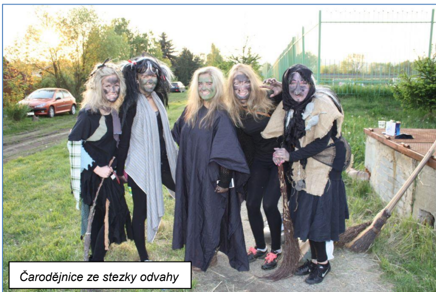
Čarodějnice ze stezky odvahy