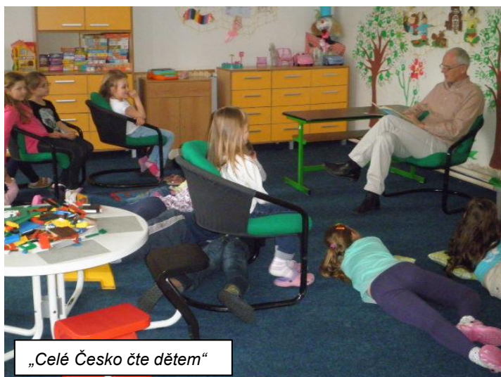
„Celé Česko čte dětem“

Naše základní škola je zapojena do projektu CELÉ ČESKO ČTE DĚTEM. V rámci tohoto projektu se denně ve ŠD po obědě předčítá kniha vybraná dětmi. Součástí tohoto projektu je možné zpestření předčítání tím, že jednou za čas pozveme někoho, zajímavého, významného, příjemného kdo dětem předčítá místo p. vychovatelky. Pro děti je to příjemné překvapení.