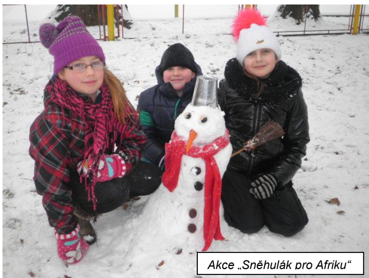
Akce „Sněhulák pro Afriku“