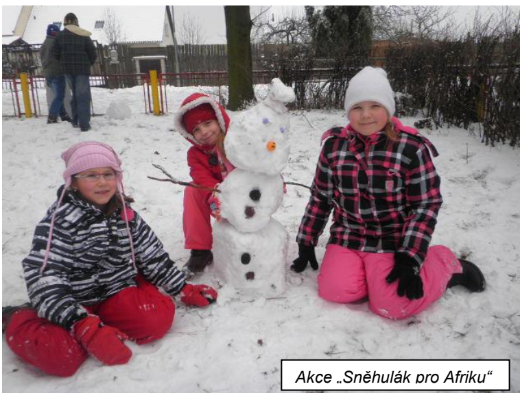
Akce „Sněhulák pro Afriku“

Děti ze základní i mateřské školy pravidelně dochází do místní knihovny. Spolupráce s paní