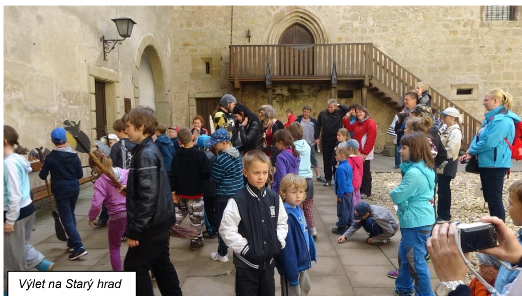
Výlet na Starý hrad

stará půda, při které se děti učily létat na koštěti za vedení zkušené čarodějnice přes 350 let staré a mistra Archibalda spojené s prohlídkou Čarodějnické bestyjoly. Následovalo volno, kdy si děti mohly zakoupit různé upomínkové předměty - meče, kuše, přilbice a jiné. Velký počet dětí si zakoupilo pohádkové