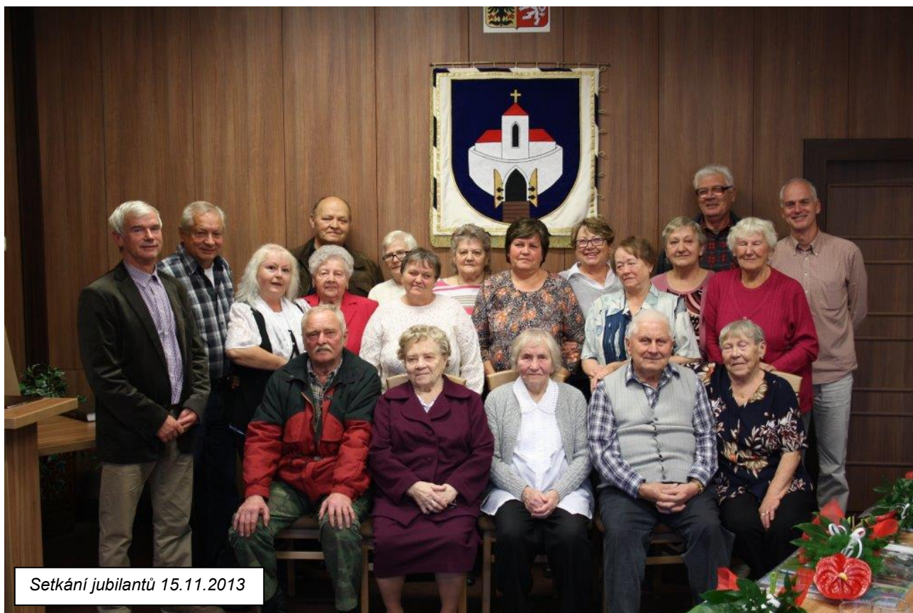
Setkání jubilantů 15.11.2013