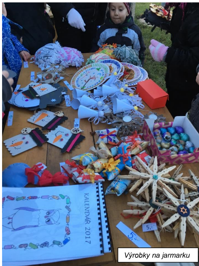
Výrobky na jarmarku