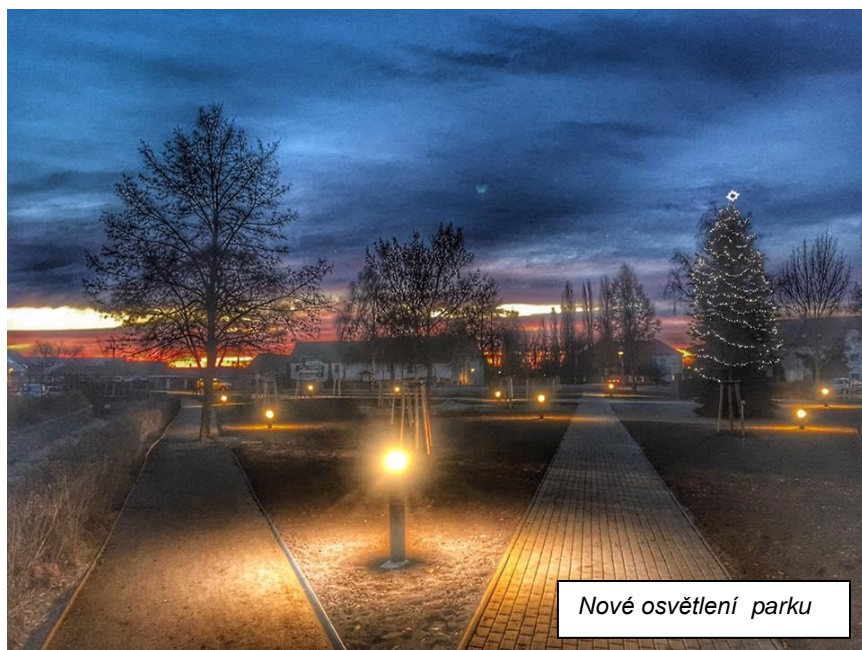
Nové osvětlení parku

Již dvakrát jsme Vás podrobně informovali o projektu pod názvem „ Revitalizace náměstí generála Svobody, Spořice, 1. etapa – PARK “. Na konci roku byly předány stavební práce, osvětlení a byl také instalován nový pomník všem padlým za svobodu. V rámci akce „Náhradní výsadba Spořice 2016“, byla provedena výsadba nových stromů a keřů, kterou včetně tříleté péstební péče hradí Severočeské doly a.s.