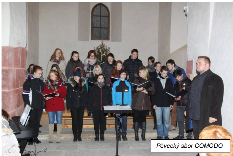
Pěvecký sbor COMODO

„ Novoroční přípitek “ o půlnoci 31. prosince 2016 před Hasičskou zbrojnicí, kde byl pro přítomné připraven kromě tradičního „šampusu“ i krásný ohňostroj.