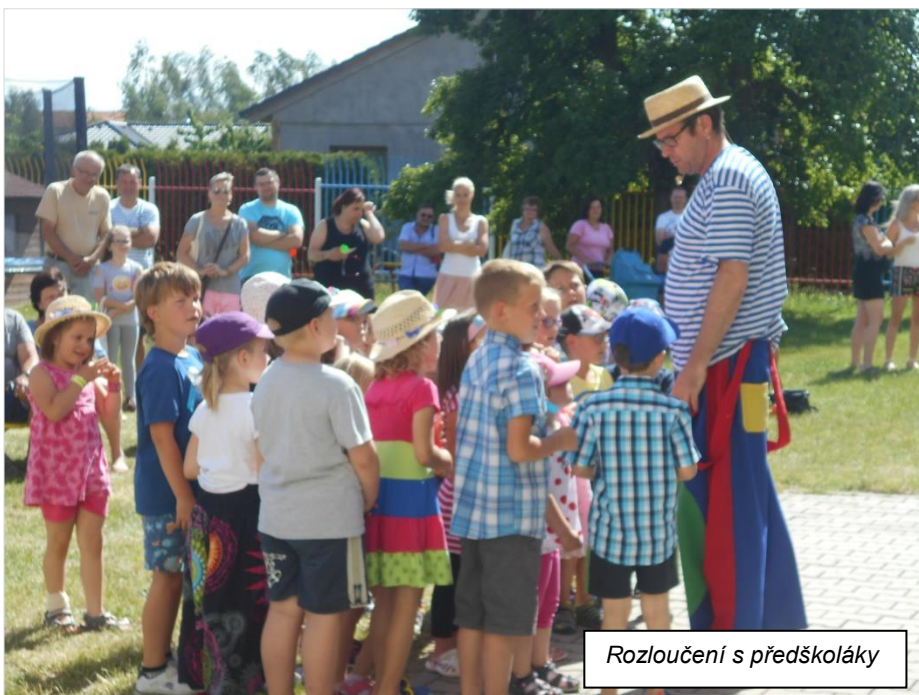
Rozloučení s předškoláky

Na konci školního roku jsme se vydali na celodenní výlet do Ústí n/L. Děti se svezly lanovkou, prošly bludištěm a cestou s výhledem na hrad Střekov došly až k Vaňovským vodopádům. Všem se výlet líbil. Celá školka se tradičně zúčastnila akademie vesnických školek tentokrát v Údlících. Konec školního roku jsme zakončili pasováním předškoláků na školáky s hudebním představením „Hnedle vedle“. Pak jsme si užili krásné prázdniny a nyní na začátku nového školního roku nás navštíví ve školce pár divadelních představení s pohádkami. V říjnu nám školku vyzdobí „podzimní lucerničky“ vyrobené našimi rodiči a dětmi. A celá školka se těší na večerní „Ducháčkovu cestu“ na konci října, kde se společně pobavíme s dětmi i rodiči.