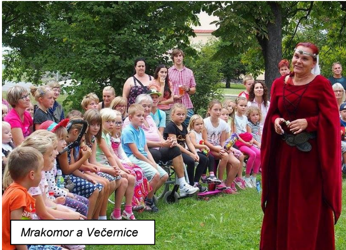
Mrakomor a Večernice

Letos poprvé byla doplněna o páteční divadelní představení pod širým nebem u kostela sv. Bartoloměje a to hned o dvě! Od 17-ti hodin nám Divadlo „BezeVšeho“ zahrálo pohádku pro děti Mrakomor a Večernice. V 19:00 hodin vystoupilo „Docela velké divadlo“ s představením Tři