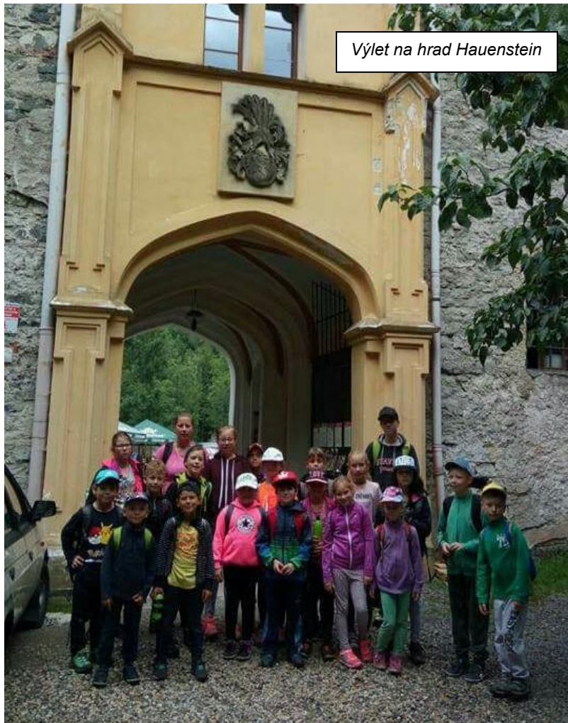
Výlet na hrad Hauenstein

Třetí den se byly děti podívat na hasiče u Hasičského záchranného sboru Ústeckého kraje v Chomutově. Tady si mohly prohlédnout prostory, kde hasiči tráví čas, když nezasahují a prostory kde probíhá školení. Také viděly skluzné tyče, po kterých jezdí hasiči do garáže. Dále si v garážích prohlédly techniku, mohly si vyzkoušet i