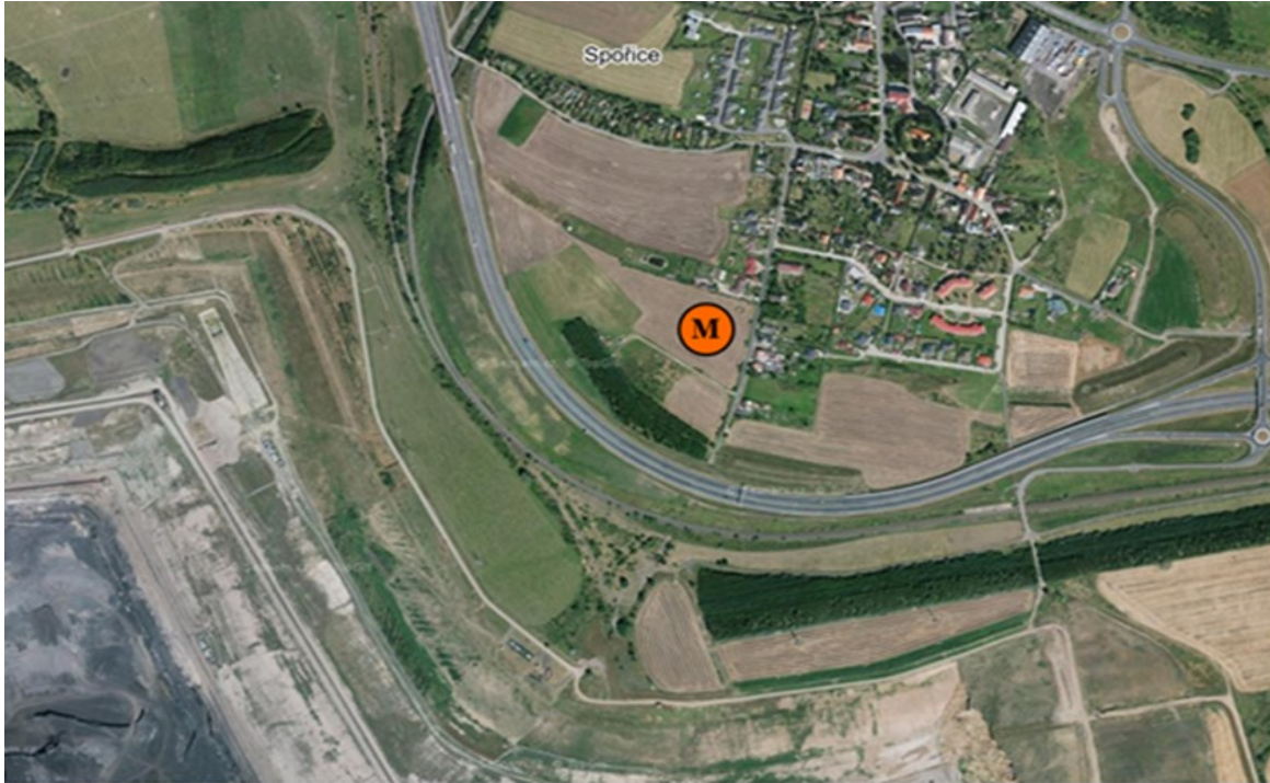
Obr. 1 Poloha měřicího místa v lokalitě – letecký snímek