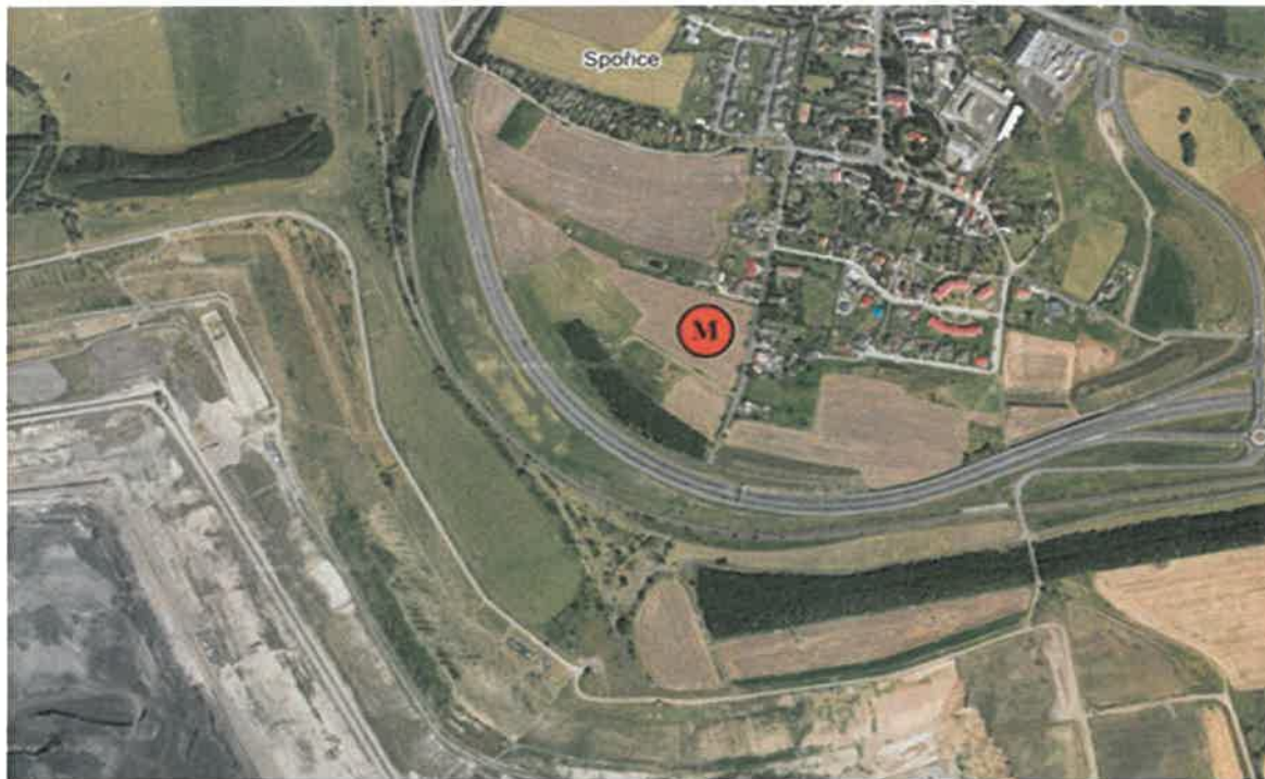
Obr. 1 Poloha měřicího místa v lokalitě – letecký snímek