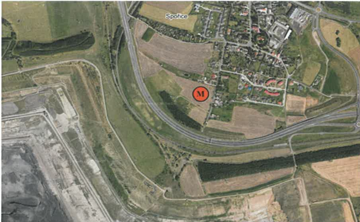
Obr. 1 Poloha měřicího místa v lokalitě – letecký snímek