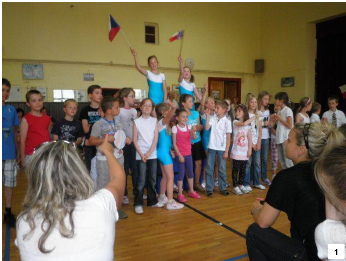
1 - Akademie 2012 – Sokol – vystoupení žáků školy. Děti zpívaly, recitovaly a tančily sestavy, které se naučily během školního roku.