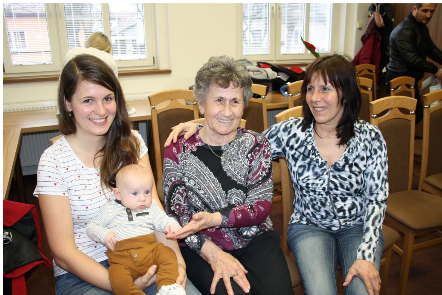
Foto dole - setkání čtyř generací Svobodových. Další fotografie z vítání občánků ve Společicích naleznete na webových stránkách obce nebo na obecním facebooku.