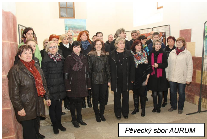
Pěvecký sbor AURUM

obrazů. Zájemci si vystavená díla mohli prohlížet až do konce měsíce dubna. Celkem obrazy vidělo 288 návštěvníků, což je zajisté úctyhodný počet. A ještě postřeh pravidelné asistentky našich výstav: „Lidé z širokého okolí teď Spořice doslova „objevili“ a netají se slovy obdivu k opravenému kostelu, jeho okolí i využití. Často jsem si až z jejich reakcí uvědomila, že tu máme skutečně pěknou památku, na kterou můžeme být pyšní...“ A tak jsou podobné akce vlastně dobrou propagací obce. Všechny výstavy v kostele jsou přístupné vždy ve čtvrtek, sobotu a také v neděli od 14 do 17 hodin.